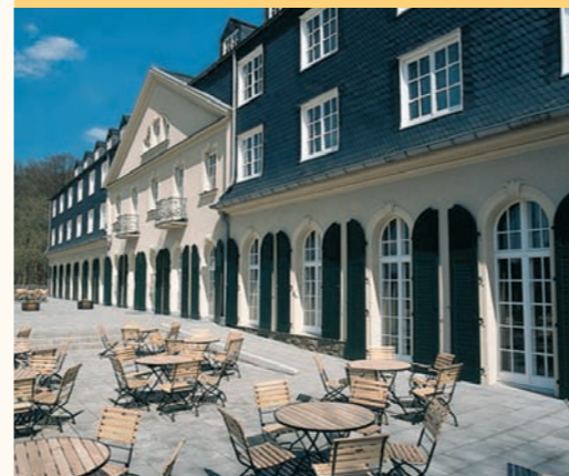
Maria in der Aue