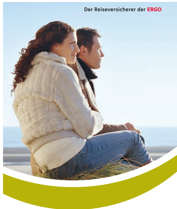
Der Reiseversicherer der ERGO

Termin: Samstag, der 29.09.2012 (1 Tag). Beginn 11:30, Anmeldung erwünscht.