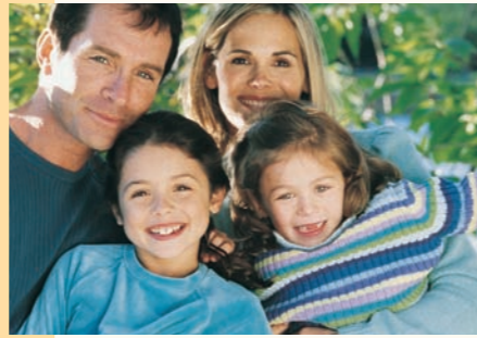
Urlaub für die ganze Familie.