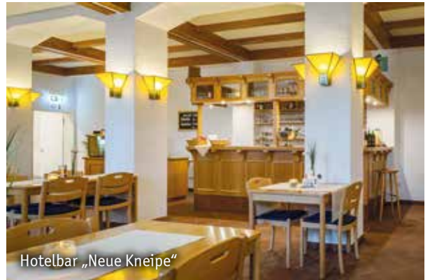
Hotelbar „Neue Kneipe“