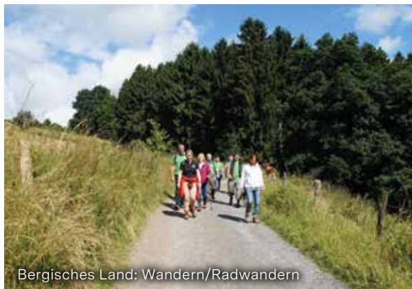
Bergisches Land: Wandern/Radwandern