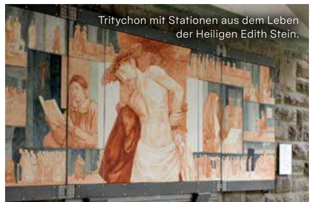
Tritychon mit Stationen aus dem Leben der Heiligen Edith Stein.