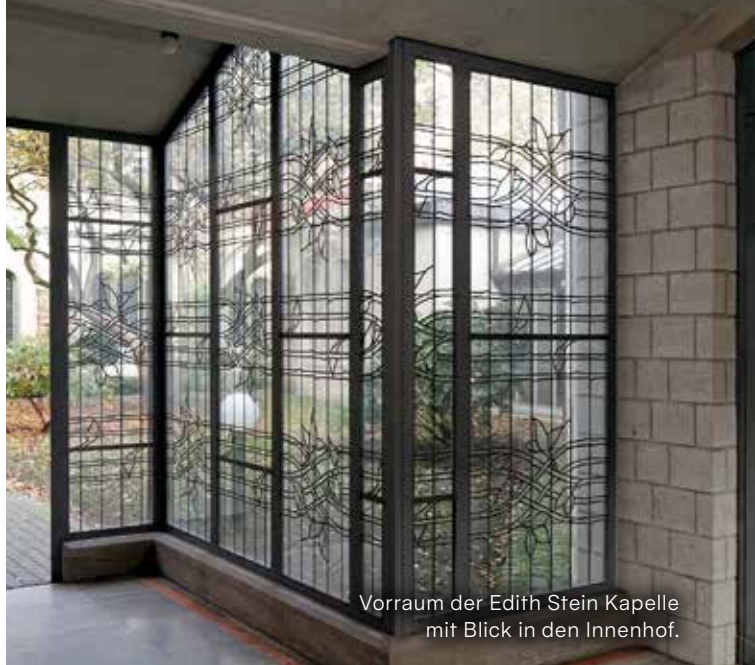
Vorraum der Edith Stein Kapelle mit Blick in den Innenhof.

Die Eingangstür vom Foyer zum Vorraum der Kapelle ist mit Darstellungen des Ur-Kampfes zwischen Licht und Finsternis geschmückt. Michael ist erkennbar. Sein Schild trägt seinen Namen in Latein: Quis ut Deus (Wer ist wie Gott?). Der Fürst des Lichtes behütet nach alter Weise den Zugang zur heiligen Stätte.