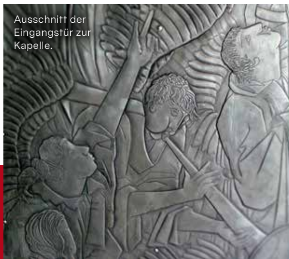
Ausschnitt der Eingangstür zur Kapelle.

Die Beschlagnahmung des Hauses durch die GESTAPO 1941 hat zur Folge, dass die Seminaristen - für kurze Zeit waren sie wieder in Bensberg - das Haus erneut verlassen müssen. Ab 1944 wird das Kardinal Schulte Haus Kriegs-Lazarett der Wehrmacht und von 1945 bis 1948 Kriegs-Lazarett der unterschiedlichen alliierten Streitkräfte. Ab dem 27. April 1948 befindet sich das Priesterseminar wieder in Bensberg bis zum Umzug des Seminars in einen Neubau nach Köln im Jahre 1958.